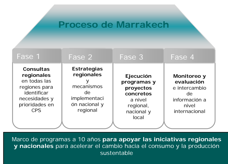
Figura 1. Fases o Áreas de Acción del Proceso de Marrakech

El desarrollo de estas etapas o acciones no es lineal ni tiene un orden cronológico. Las fase o áreas de acción pueden llevarse a cabo de forma paralelo, y son más bien parte de un proceso continuo de revisión y fortalecimiento de estrategias y metodologías.