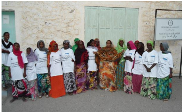
Distribution des t-shirts à Randa

L'AFT devrait fournir une réponse à cette question, même si la subvention a été correctement utilisée et comptabilisée.